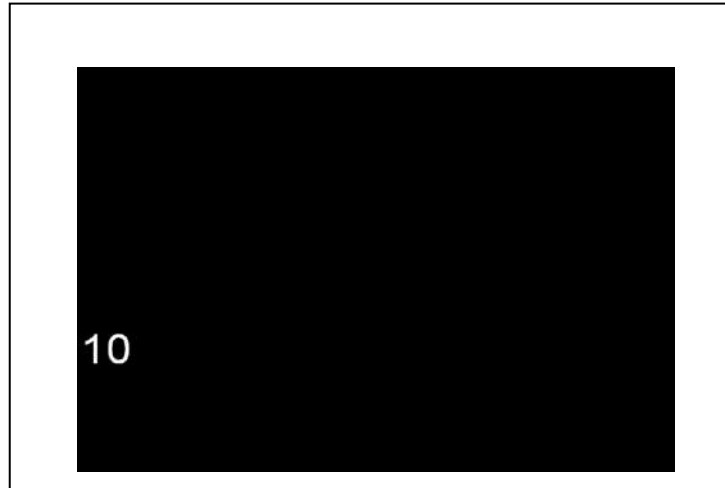
Sepuluh langkah utama dalam Penelitian dan Pengembangan Borg & Gall (2003)

Sesungguhnya kesepuluh langkah utama yang dikemukakan Borg & Gall, bila dibandingkan dengan sepuluh langkah dalam model pengembangan sistem instruksional yang dikemukakan oleh Dick and Carey memiliki kesamaan dalam kerangka berpikirnya. Bahkan Borg & Gall (2003), mengatakan bahwa langkah-langkah penelitian dan pengembangan dalam bidang pendidikan yang sesungguhnya adalah langkah-langkah yang terdapat dalam Model Pengembangan Instruksional yang dikembangkan oleh Dick & Carey. Berikut ini adalah langkah-langkah pengembangan instruksional Dick & Carey.